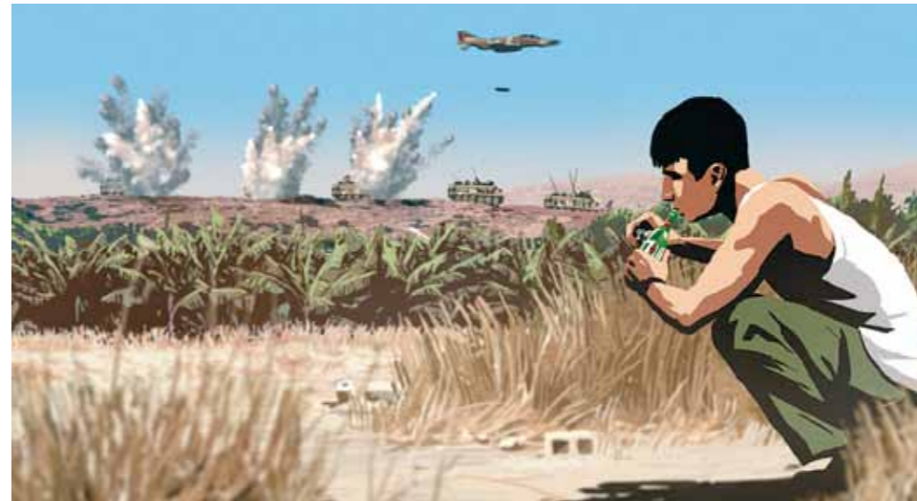
מתוך הסרטים "נונס העתידינים" ו"ואלס עם באשיר". סימנו את תחילת הפריחה