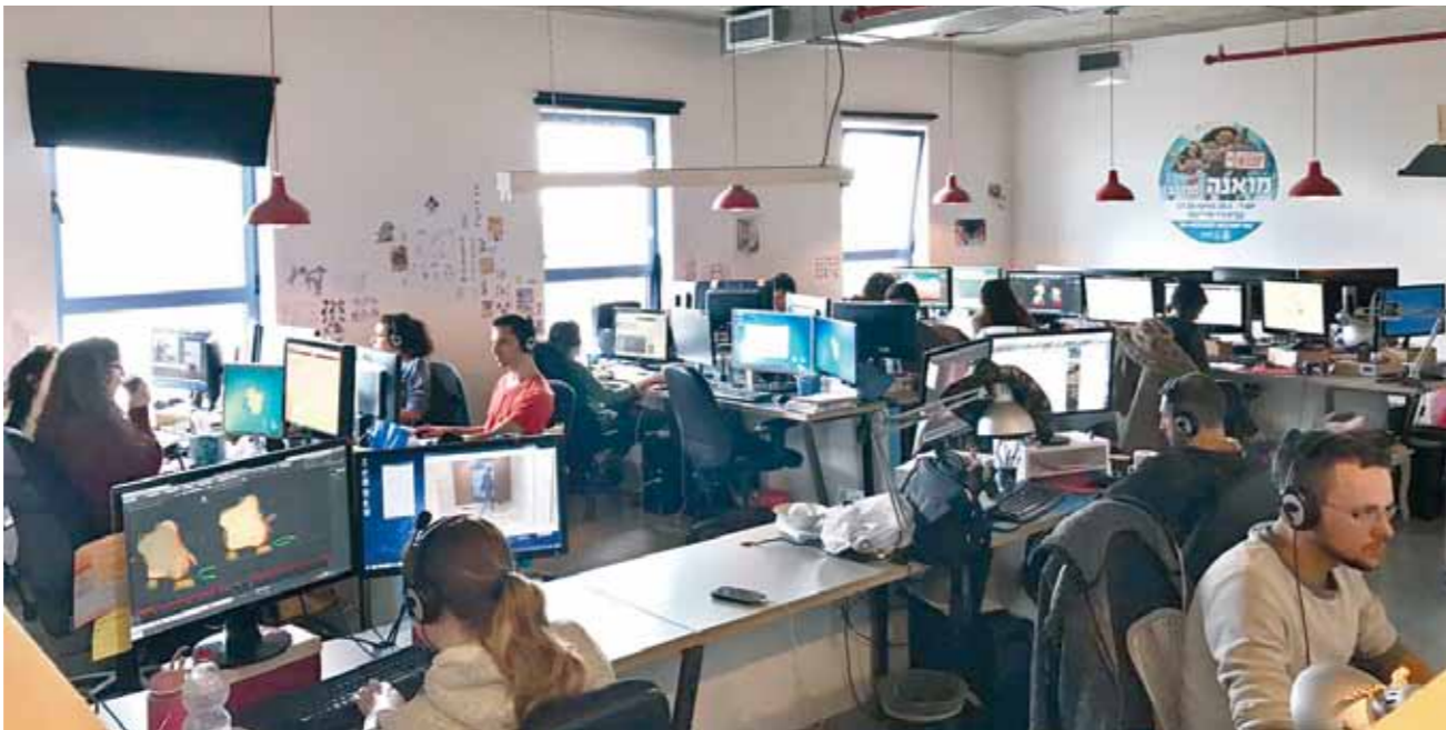
סטודיו snowball בירושלים. "לעשות פרויקטים עבור דיסני זה חלום שהתגשם"